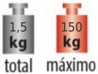
Tabla de medidas y modelos