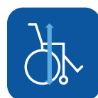
Altura total ▼