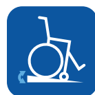
Pendiente máxima con frenos de estacionamiento ▼