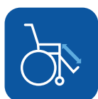
Regulación de los reposapiés ▼