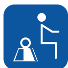
Peso máx. usuario ▼