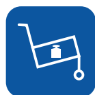
Peso de transporte ▼