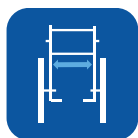
Anchura asiento ▼

Para obtener información más completa acerca de este producto incluyendo el manual del usuario, consulte la página web www.invacare.es