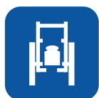
Peso total ▼