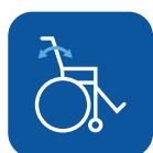
Reclinación de respaldo ▼