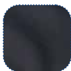
Tapizado negro suave