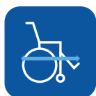
Largo total con reposapiés** ▼