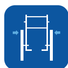
Anchura total ▼