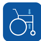
Altura reposabrazos ▼