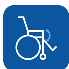
Ángulo de asiento ▼