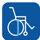
Altura asiento ▼