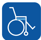
Profundidad asiento ▼